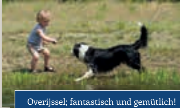
Overijssel; fantastisch und gemütlich!