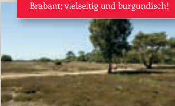
Brabant; vielseitig und burgundisch!