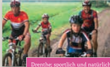
Drenthe; sportlich und natürlich!