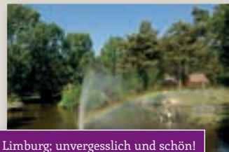
Limburg; unvergesslich und schön!