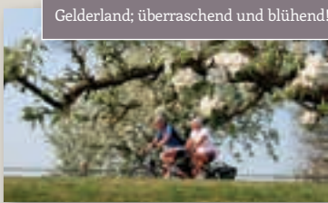
Gelderland; überraschend und blühend!