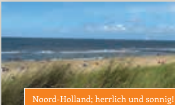
Noord-Holland; herrlich und sonnig!